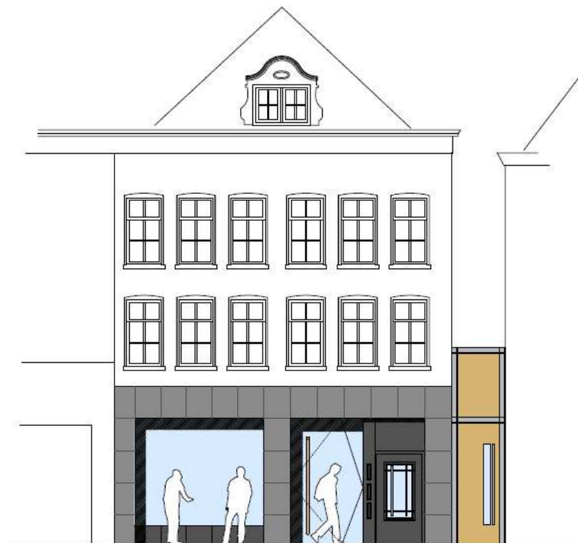
gevel oude vismarkt